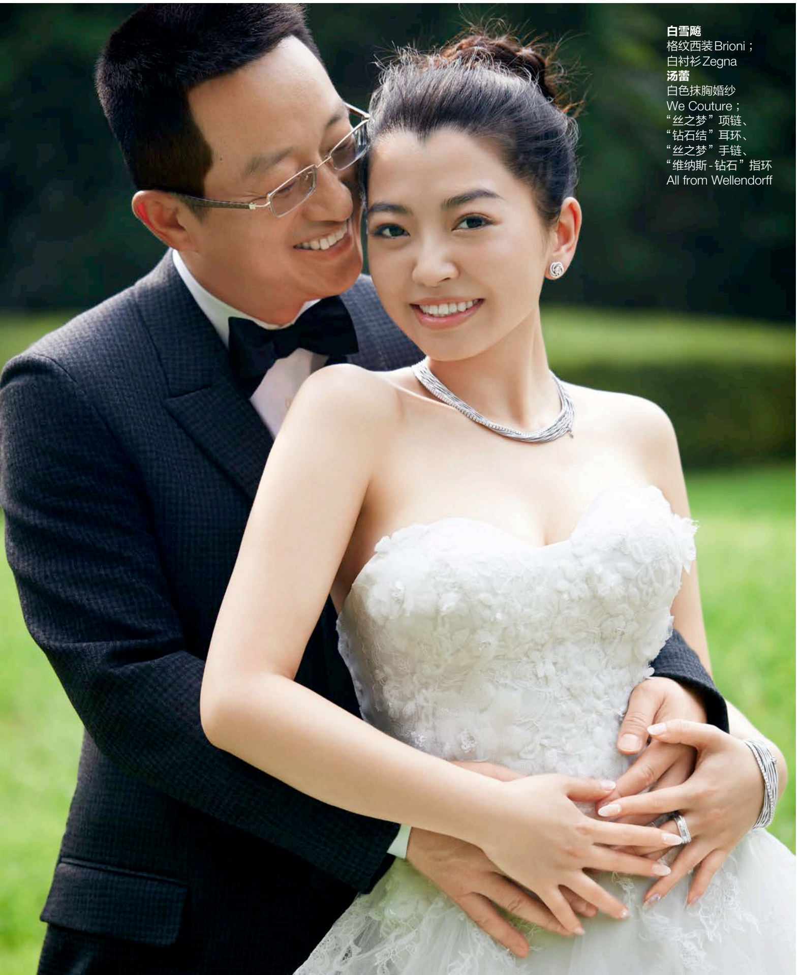
白雪隧 格纹西装Brioni ; 白衬衫Zegna 汤蕾 白色抹胸婚纱 We Couture ; “丝之梦”项链、 “钻石结”耳环、 “丝之梦”手链、 “维纳斯-钻石”指环 All from Wellendorff