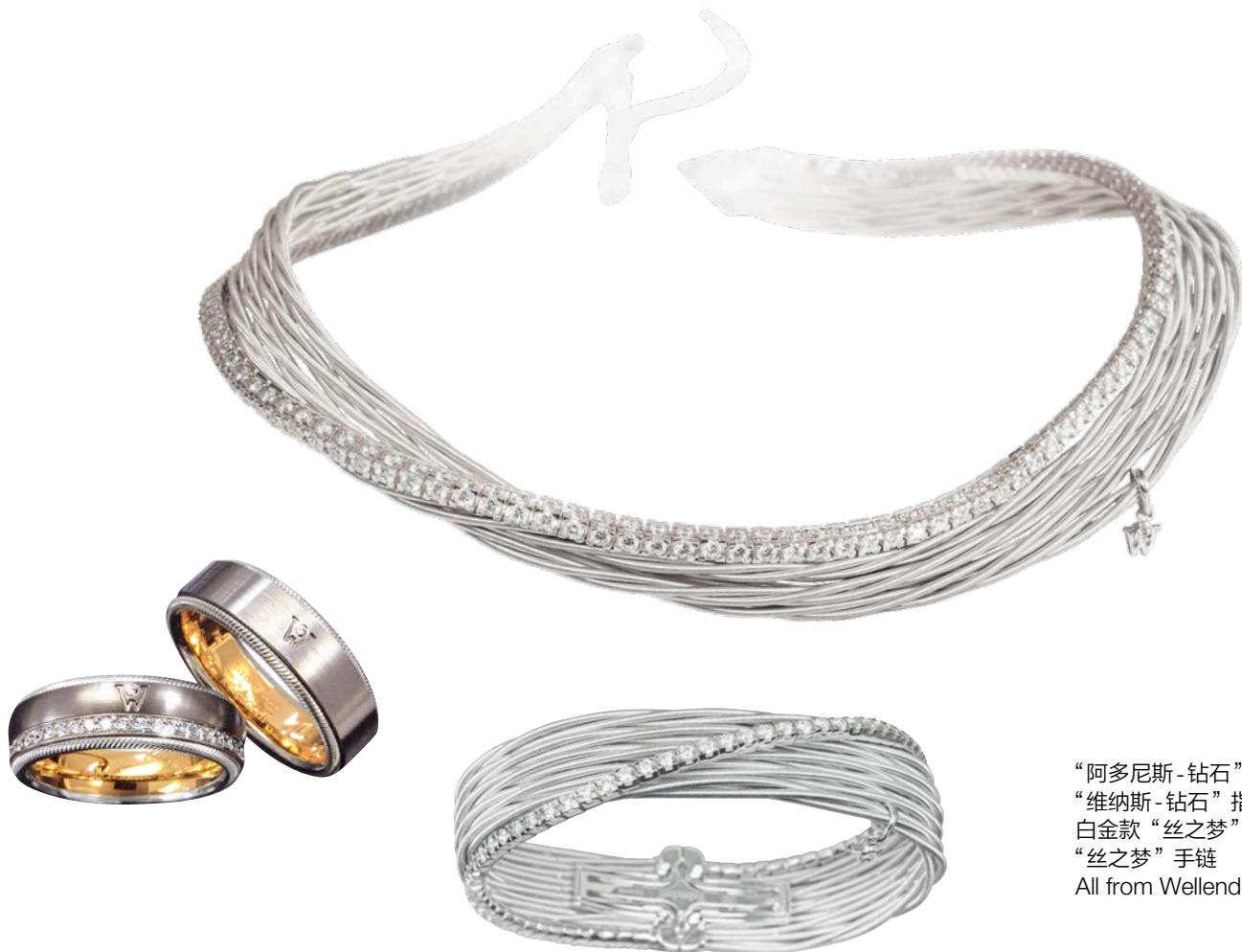
“阿多尼斯-钻石”指环、 “维纳斯-钻石”指环、 白金款“丝之梦”项链、 “丝之梦”手链 All from Wellendorff