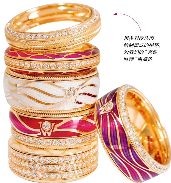
用多彩冷珐琅绘制而成的指环，为我们的“喜悦时刻”而准备

如今在德国，华洛芙早已是许多人从自己孩提时代起就十分熟悉的名字，甚至可以说，它就像是一位家族的老朋友，见证了几代人的成长之路，