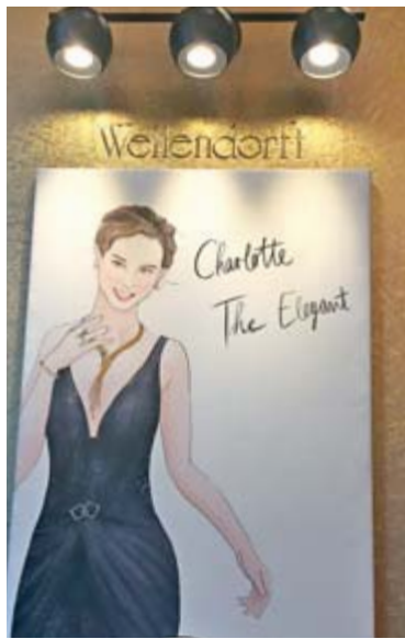
02+03 // 品牌做了一個如何挑選稱身首飾的研究，結論是珠寶不止是飾物，而是可以說故事，同時亦可以展現真我個性。品牌為我這個實幹型配上Fine Silken Dream白金項鍊和手鐲，又確實很合我口味。

品牌為優雅型女士配上Rope Dreams系列的Shooting Star項鍊，金絲編花繩索以嶄新工藝重新演繹。Y形項鍊共有三百七十個焊接接合點，極致工藝有目共睹。